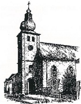
St. Philippus und Jakobus