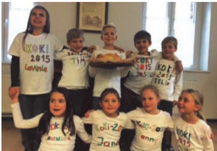
Kommunionkinder 2015 von St. Martinus Barmen/Merzenhausen

„Gemeinschaft“ das ist eine überschaubare Gruppe, deren Mitglieder durch ein starkes „Wir-Gefühl“ eng miteinander verbunden sind. Diese überschaubare Gruppe ist für unsere Kinder zuerst einmal die Familie. Aber im Laufe der Zeit lernen sie auch die kirchliche Gemeinde kennen, bzw. erfahren in der Kommunionvorbereitung kirchliche Formen des Zusammenlebens, welche nicht nur aus dem Besuch der Kirche bestehen.