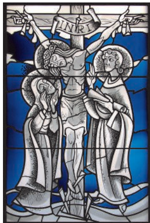
Fensterbild in St. Mariä Namen, Gensungen (Nikolaus Bette, Essen)

Die nun schon 4. Matinee zur Marktzeit wird am Samstag, den 21. März, um 12 Uhr in der Propsteikirche stattfinden. An diesem Samstag, dem Tag vor dem 5. Fastensonntag, ist