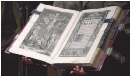
Foto: Aus dem Stettener Kirchschatz

Waren Sie schon mal in der Domschatzkammer in Aachen? Waren Sie auch schon mal in der Schatzkammer der Pfarrei Hl. Geist?