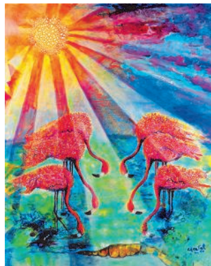
Titelbild zum Weltgebetstag 2015 von den Bahamas, „Blessed“, Chantal E. Y. Bethel/ Bahamas

Sie laden uns ein, ihre Lebenssituation kennenzulernen: karibische Gelassenheit und die Traumstrände, aber auch wirtschaftliche Abhängigkeit vom Tourismus, gesellschaftliche Notlagen durch Armut, Krankheit, Perspektivlosigkeit und die hohe Verbreitung von Gewalt gegen Mädchen und Frauen.