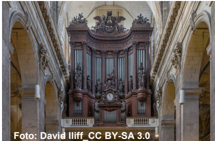
Uraufführung in Saint-Sulpice, Paris

1899 entstand die berühmte „Messe solennelle op. 16“ von Louis Vierne. Der Komponist wurde 1870 in Poitiers geboren.