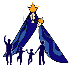
Kirche unterwegs Wallfahrt Kevelaer

Die Gemeinden Güsten, Mersch/Pattern, Stetternich und Welldorf laden für Donnerstag, den 15.09.2022, alle Interessierten zur traditionellen Buswallfahrt nach Kevelaer ein.