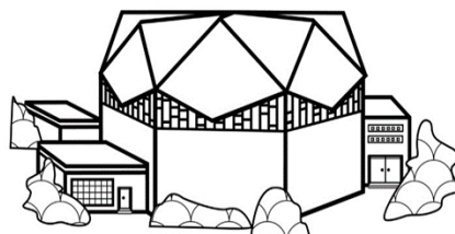
50 JAHRE KIRCHE ST. FRANZ SALES

Im Rahmen des Goldjubiläums der St. Franz Sales-Kirche im Jülicher Nordviertel finden in diesem Jahr verschiedene Aktivitäten statt.