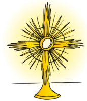
Grafik: Sarah Frank in: Pfarrbriefservice.de