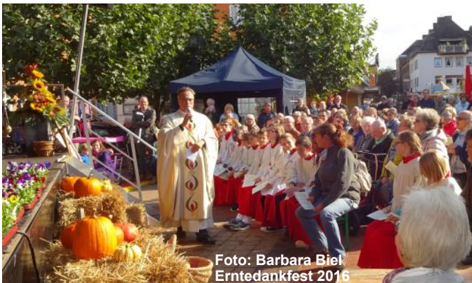
Erntedankfest 2016

In diesem Jahr wird auf dem Jülicher Markt und den angrenzenden Straßen wieder Erntedank gefeiert - das 38. Fest der Jülicher Werbegemeinschaft, die die Besucher und Besucherinnen zu diesem Anlass vom 4. bis 6. Oktober mit vielfältigen Angeboten erwartet und erfreut.